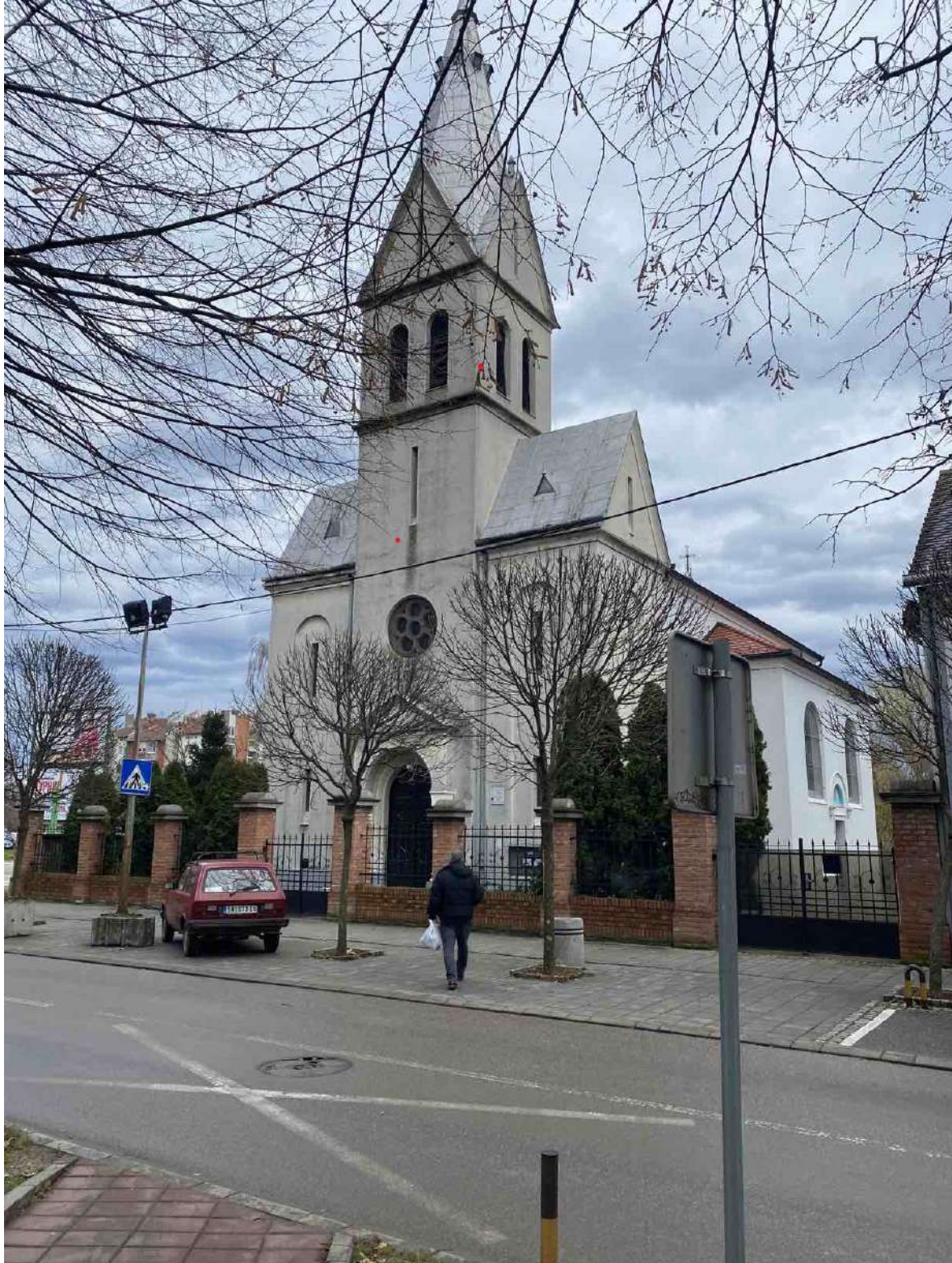
Грkokатоличка црква Вазнесења Господњег