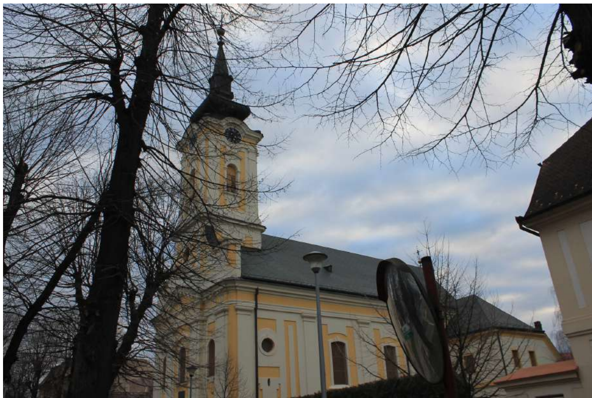
Римокатоличка црква Светог Димитрија

Црква је, заједно са суседним жупним двором, споменик културе од великог значаја.