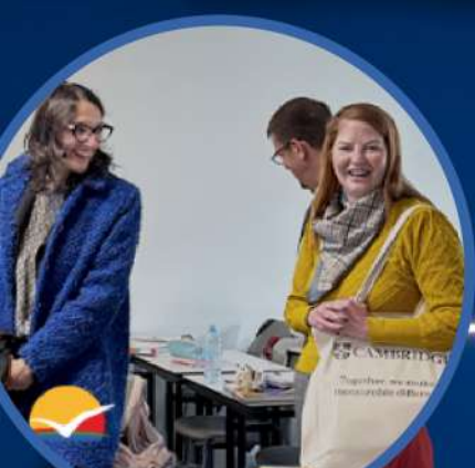
SAVREMENA GIMNAZIJA IMPRESIONIRALA CAMBRIDGE DELEGACIJU