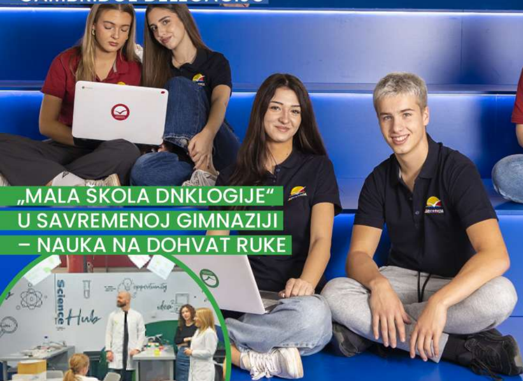
„MALA ŠKOLA DNKLOGIJE“ U SAVREMENOJ GIMNAZIJI – NAUKA NA DOHVAT RUKU